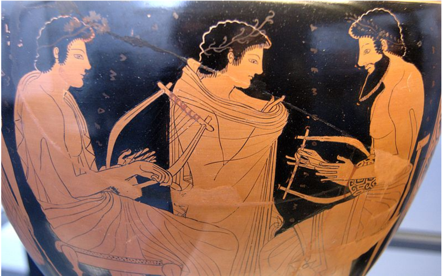
Lekcja muzyki – nauczyciel i uczeń, a między nimi chłopiec dyktujący tekst. Waza czerwonofigurowa, około 510 r. p.n.e, Staatliche Antikensammlungen Museum

poświęcił muzyce (w księdze VIII). Uważał on, że z czterech przedmiotów, które obejmuje wychowanie (gramatyka, gimnastyka, muzyka, rysunki), muzyka zasługuje na szczególną uwagę, bo choć „gramatyka i rysunki są pożyteczne w życiu i mają w wielu wypadkach zastosowanie, gimnastyka zaś zaprawia do męstwa”, a w przypadku muzyki można mieć wątpliwości co do jej użyteczności, ma ona jednak ważne miejsce — służy do szlachetnego i godnego wypełnienia czasu wypoczynku. Odpoczynek, co Arystoteles wielokrotnie podkreślał, jest celem wszelkiej działalności człowieka, a rozrywki „należy wprowadzić z uwzględnieniem właściwego na to czasu, tak jak się zażywa lekarstwa. Tego rodzaju poruszenie duszy jest bowiem odprężeniem, i z powodu związanej z tym przyjemności — wytchnieniem”.