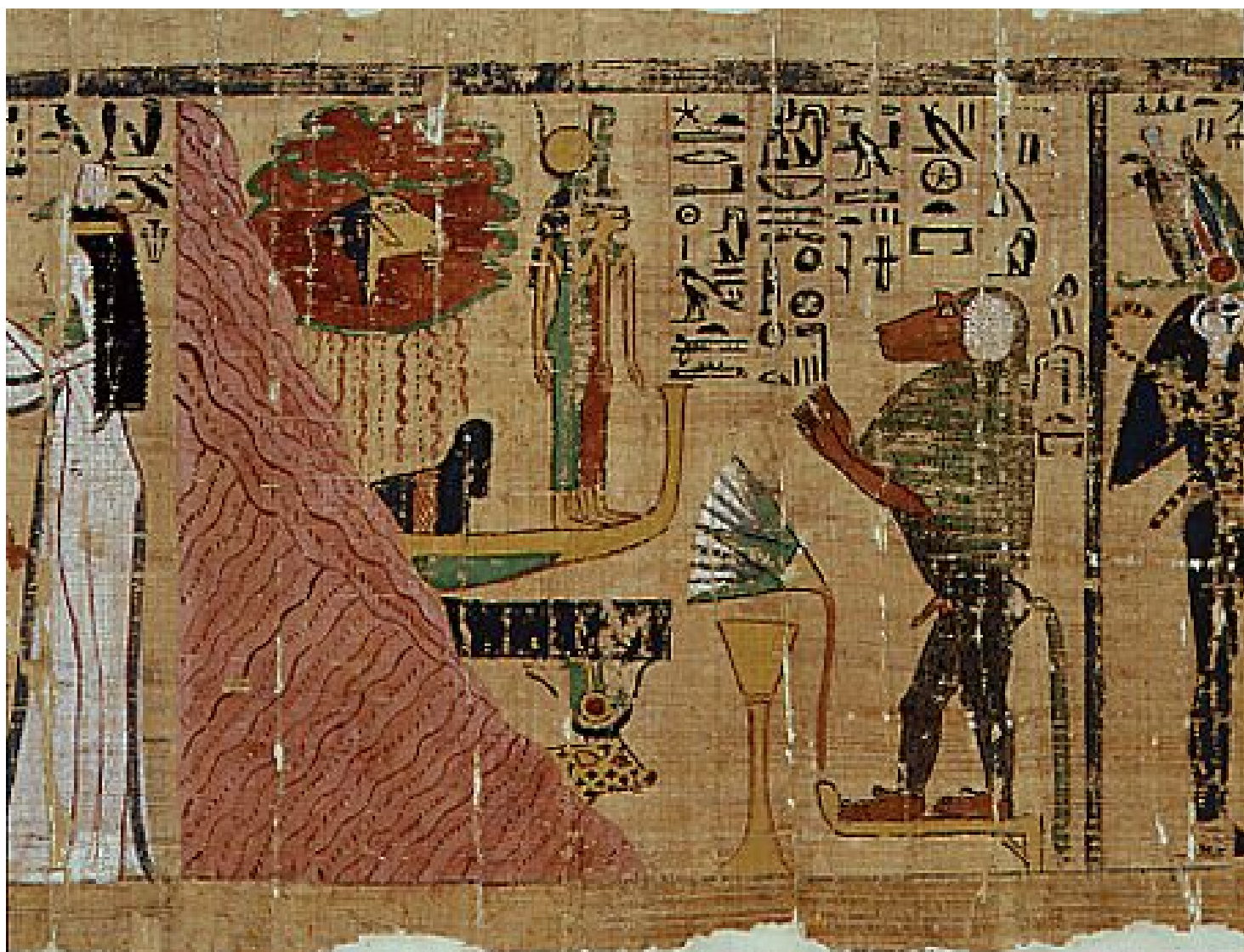
Papirus mitologiczny, tancerki Amona Themenmut, Egipt Teby, papirus polichromowany, Muzeum Narodowe w Warszawie