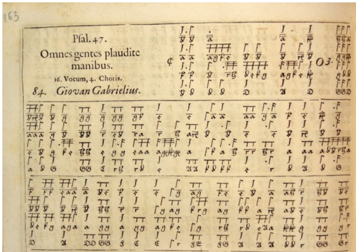
Niemiecka tabulatura organowa

W drugiej połowie XVI wieku zmodyfikowano tę notację zapisując wszystkie głosy literami. Ten typ, stosowany jeszcze przez cały wiek XVII, zwany jest tabulaturą nowoniemiecką .