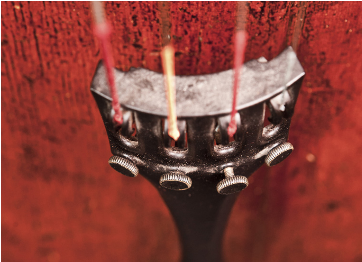
strunnik wiolonczeli ze stroikami