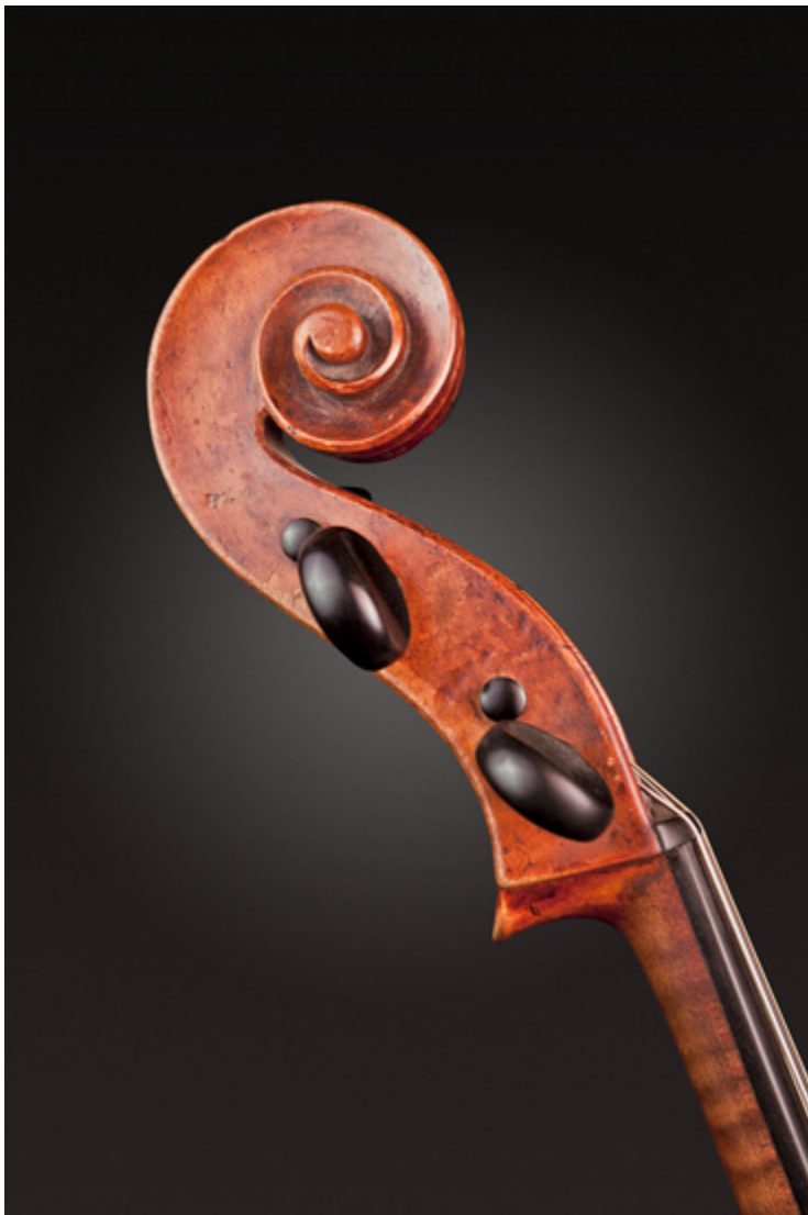
bok główki wiolonczeli z kołkami

W ostatnich dekadach używa się także wiolonczeli elektrycznej, w której niepotrzebne jest pudło rezonansowe; dźwięk uzyskiwany jest poprzez jego elektroniczne wzmocnienie, a nie rezonans akustyczny.