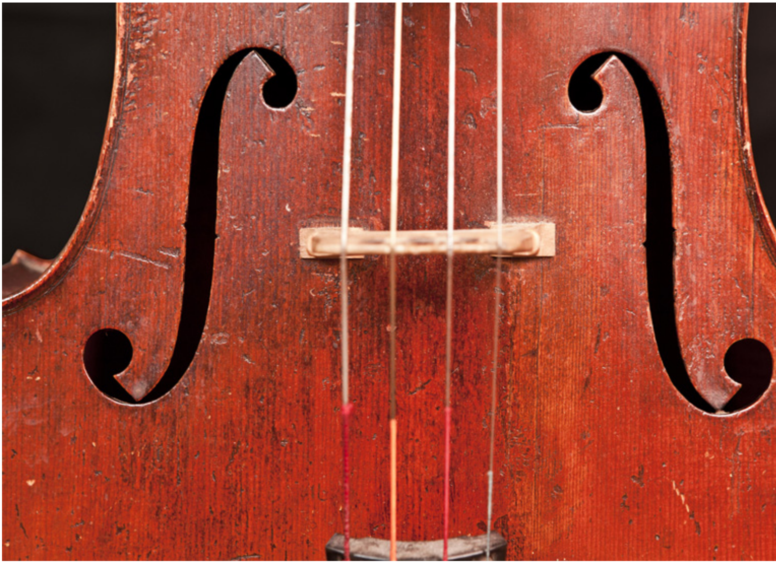
pułko rezonansowe wiolonczeli z otworami rezonansowymi, tzw. Efami