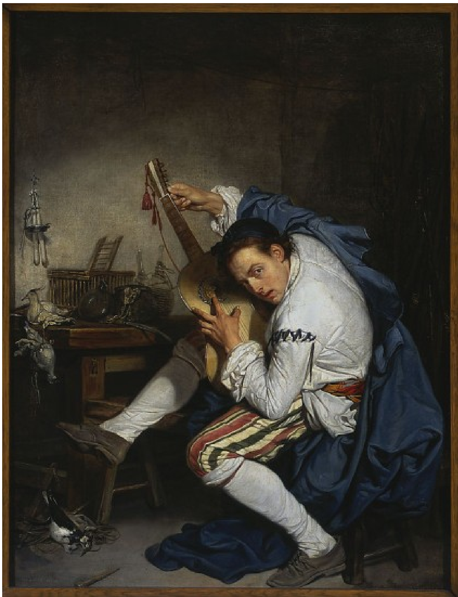
Gitarzysta, 1757, Jean-Baptiste Greuze, Muzeum Narodowe w Warszawie

Z kolei barok z końca XVII wieku i pierwszych dziesięcioleci wieku kolejnego to tendencja do monumentalizacji — utwory