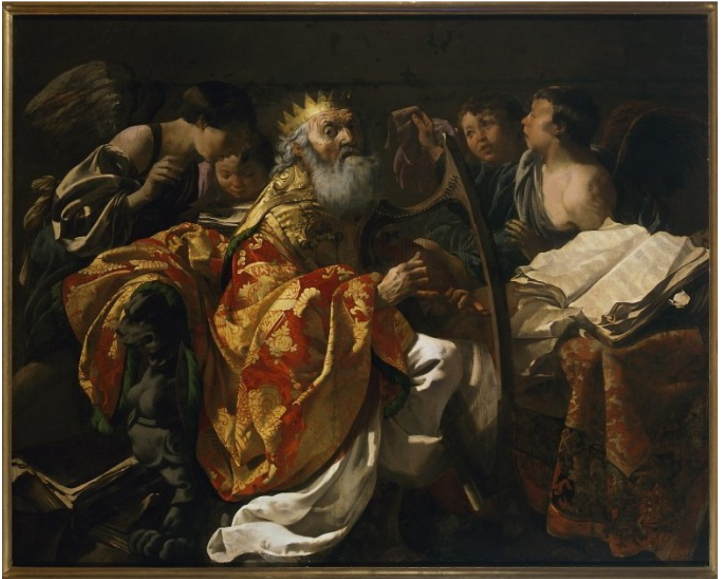
Król Dawid grający na harfie, 1628, Hendrick ter Brugghen, Muzeum Narodowe w Warszawie

Muzykę barokową miała odróżniać od renesansowej jej ekspresyjność i indywidualny charakter. W początkowym okresie epoki baroku chciano odrzucić polifonię , co przyczyniło się do stworzenia charakterystycznych dla całej epoki środków wyrazu jak monodia akompaniowana, bas cyfrowany czy technika koncertująca. Główną ideą, celem muzyki stało się w baroku wyrażanie emocji i wywoływanie w słuchaczu uczuć zwanych afektami.