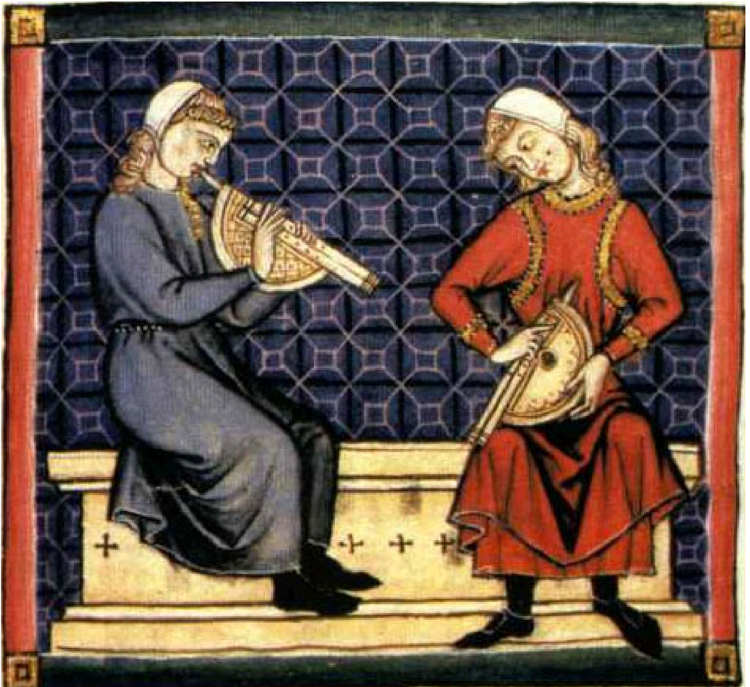
Średniowieczni muzycy grający na instrumencie podobnym do podwójnego klarnetu, autor nieznany