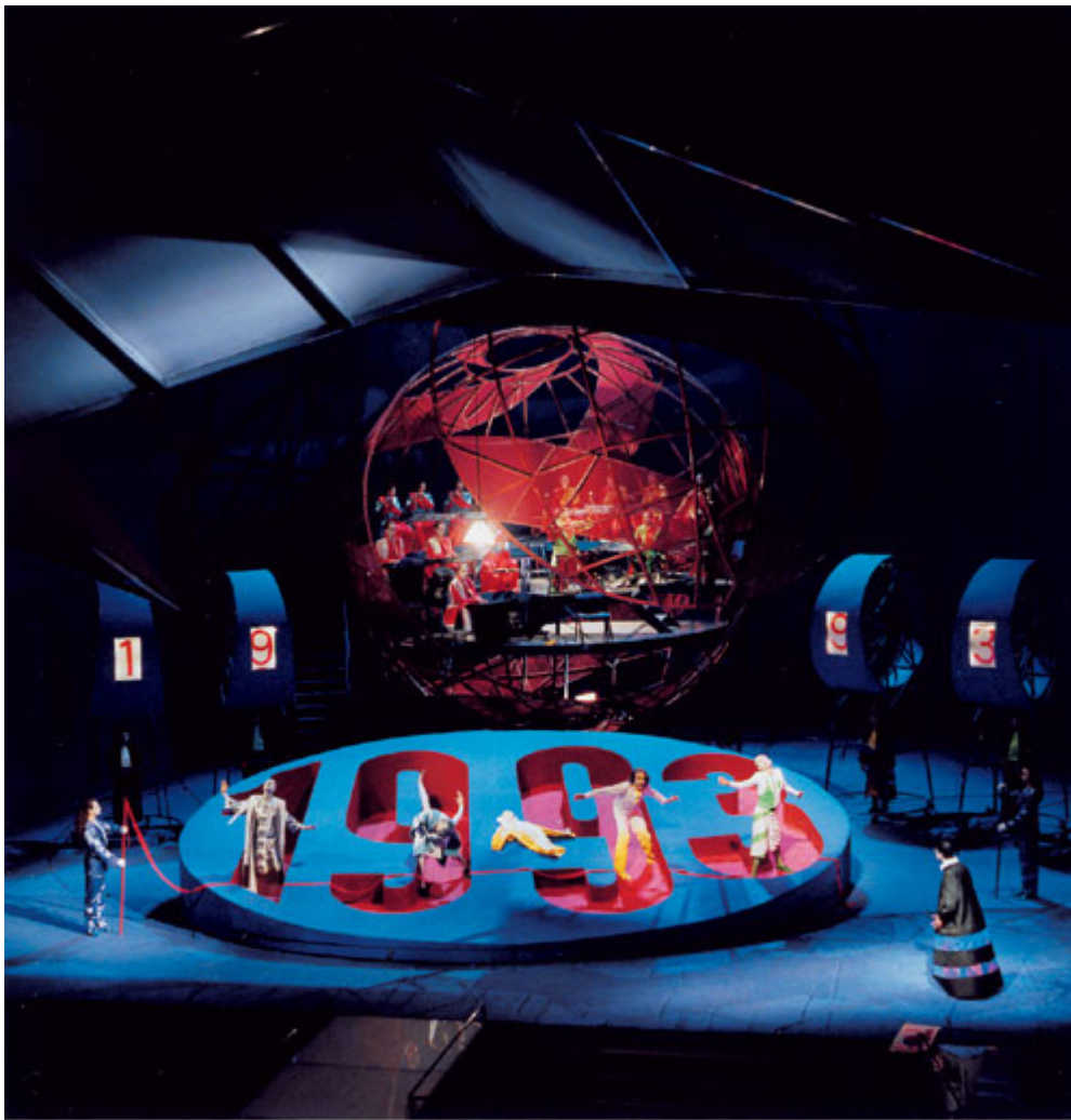
JAHRESLAUF (COURSE OF THE YEARS) Act 1 of TUESDAY from LIGHT world première, Oper Leipzig, 1993.

Innym słynnym baletem Stockhausena jest INORI ('modlitwa' po japońsku), w którym tancerka wykonuje skomplikowaną choreografię opartą na tzw. mudrach , czyli magiczno-energetycznych układach dłoni, wywodzących się z kultur Dalekiego Wschodu.